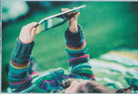
Tous les enfants cancéreux devraient être intégrés dans des études cliniques.