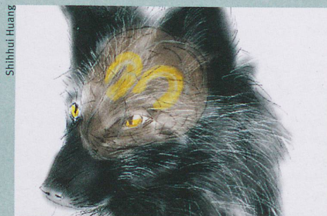
Le stress est régulé par l'hippocampe, également chez les renards apprivoisés.

S. Huang et al.: Selection for tameness, a key behavioral trait of domestication, increases adult hippocampal neurogenesis in foxes. Hippocampus, 2015