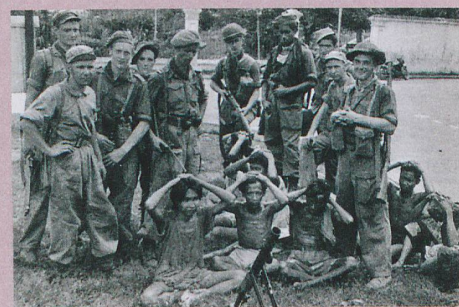
Des soldats néerlandais posent sur l'île de Java avec des prisonniers de guerre.

R. Limpach: Business as usual: Dutch mass violence in the Indonesian war of independence 1945-49, in: B. Lutikhuis et al. (Eds.): Colonial Counterinsurgency as Mass Violence. The Dutch Empire in Indonesia. Routledge, New York, 2014