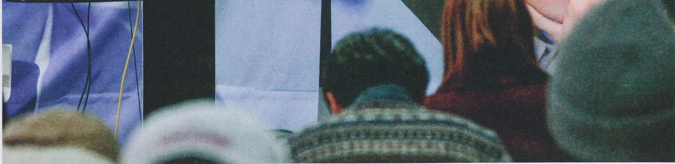
Mars 2016: Lee Sedol s'incline face à la machine dans quatre des cinq parties de go. L'algorithme a appris à négocier les 2,08 \times 10^{170} positions possibles du jeu à l'aide d'un réseau de neurones artificiels.

ture supérieure se concentrerait plutôt sur la forme générale de l'animal. Cette architecture en profondeur, où les calculs se font parfois sur plusieurs milliers de couches, a donné son nom au deep learning.