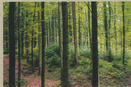
Les feuillus tels que les hêtres profiteront du changement climatique.

N. Bircher: To die or not to die: Forest dynamics in Switzerland under climate change. Ph.D. Thesis, ETH Zurich (2015)