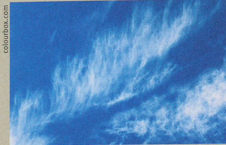
Situés hauts dans le ciel, les cirrus laissent passer les rayons solaires.