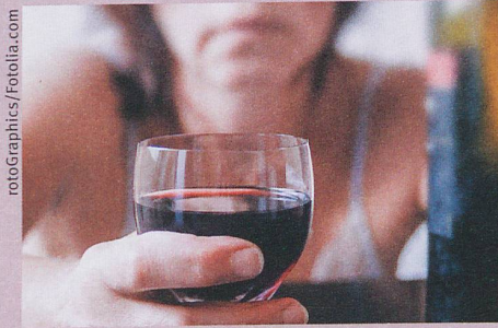
Un quotidien banal peut devenir une justification pour l'abus d'alcool.