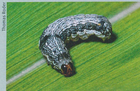
En cas d'attaque, une plante doit pouvoir gérer son stock d'insecticides.