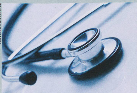
Une bonne auscultation au stéthoscope active différentes zones du cerveau du praticien.

R. De Meo et al.: What makes medical students better listener? Current Biology (2016)