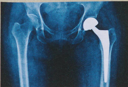
Les prothèses de hanche s'infectent parfois. Un revêtement de nanosphères pourrait aider.

M. Priebe et al.: Antimicrobial silver-filled silica nanorattles with low immunotoxicity in dendritic cells. Nanomedicine (2016)