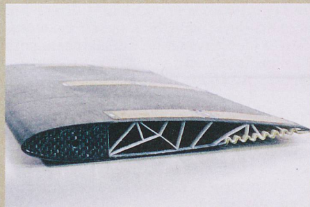
L'aile déformable de l'ETH Zurich agit comme un aileron avec une résistance de l'air réduite.

G. Molinari et al.: Aerostructural Performance of Distributed Compliance Morphing Wings: Wind Tunnel and Flight Testing. AIAA Journal (2016)