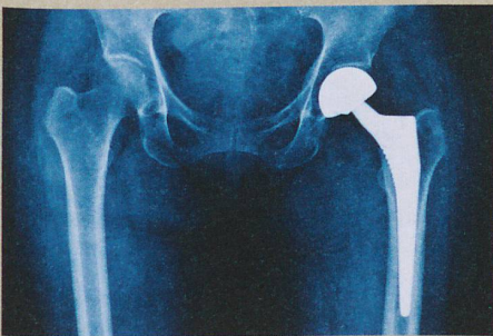
Les prothèses de hanche s'infectent parfois. Un revêtement de nanosphères pourrait aider.

M. Priebe et al.: Antimicrobial silver-filled silica nanorattles with low immunotoxicity in dendritic cells. Nanomedicine (2016)