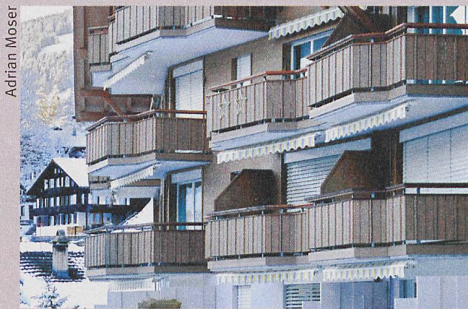
Evolution inattendue: le prix des résidences principales a diminué dans les régions touristiques.

Le programme atteint les adolescents par SMS au moment où ils boivent: en sortie.