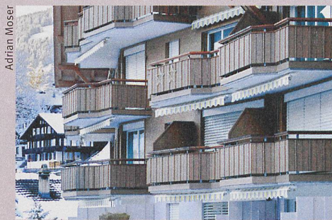
Evolution inattendue: le prix des résidences principales a diminué dans les régions touristiques.

Le programme atteint les adolescents par SMS au moment où ils boivent: en sortie.