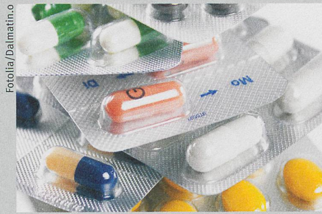
Trop de médecins et de remèdes différents augmentent les risques liés aux effets secondaires.