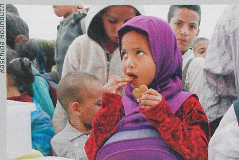
Un aliment sain et apprécié: les biscuits enrichis au fer.

R. R. Bouhouch et al.: Effects of wheat-flour biscuits fortified with iron and EDTA, alone and in combination, on blood lead concentration, iron status, and cognition in children: a double-blind randomized controlled trial. The American Journal of Clinical Nutrition (2016)