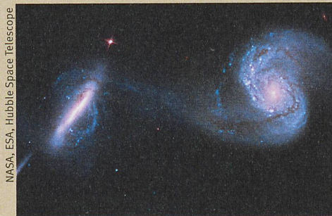
Des trous noirs supermassifs peuvent naître de la rencontre de deux galaxies.