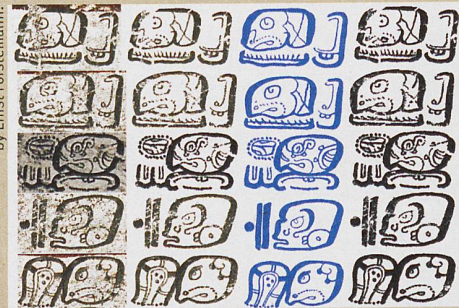
Un algorithme restaure (en bleu) des glyphes mayas du Codex de Dresde (à gauche).

Mayan hieroglyphs from the Dresden Codex, manually processed by Carlos Peñón Gavol, based on the 1880 facsimile by Ernst Förstmann.