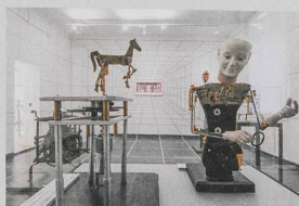
Musées antiques du Valais, Sion, Robert Tröler

L'Académie suisse des sciences naturelles (SCNAT) a attribué le Prix Expo 2016 au Musée de la nature du Valais pour son exposition «Objectif Terre: vivre l'Anthropocène». Le musée a eu le courage d'aborder sans sensationnalisme un thème très controversé, selon le jury. Il a été enthousiasmé par l'approche multidisciplinaire et la scénographie de l'exposition, qui reste ouverte jusqu'au 2 avril 2017.