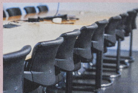
Pour éviter les incivilités lors des séances, des règles claires sont nécessaires.

I. Odermatt et al.: Incivility in Meetings: Predictors and Outcomes. Journal of Business and Psychology (2017)