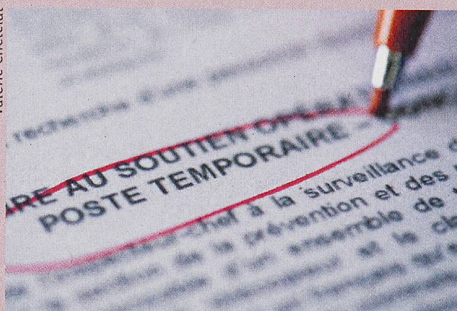
Un premier emploi temporaire offre une entrée dans le monde professionnel, mais il a un prix.

L. Helbling: Fixed-Term Jobs after Vocational Education and Training in Switzerland: Stepping Stone or Impediment? Swiss Journal of Sociology (2017)