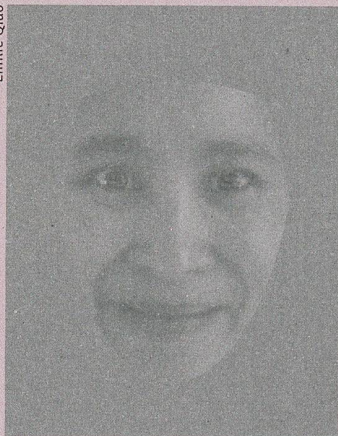
Joie ou peur? L'ambiguïté de ce visage composite révèle l'influence de nos émotions.