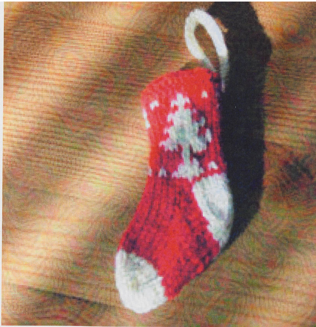
Ceci est un éléphant...