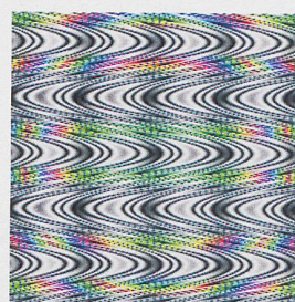
... une bédé.

d'identifier fidèlement les panneaux de signalisation routière sans se laisser tromper par des manipulations, ou encore pour les applications médicales.