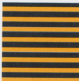
... un bus scolaire