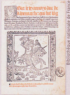
A l'origine du roman de chevalerie: une guerre commerciale.