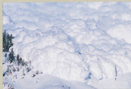
Un radar observe l'intérieur d'une avalanche artificielle déclenchée près d'Arbaz (VS).