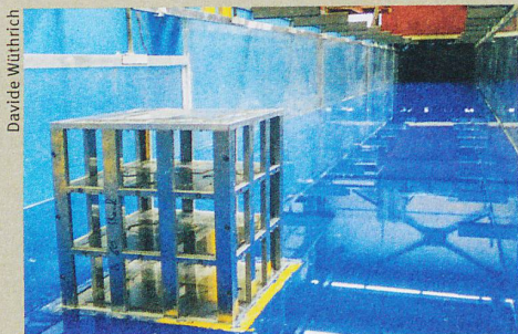
Est-ce que le bâtiment – modélisé par un cube percé d'ouvertures – résistera à la vague?