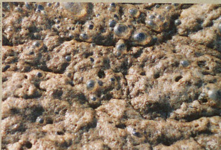
Ce qui brûle dans les boues d'épuration? Du papier de toilette, entre autres.