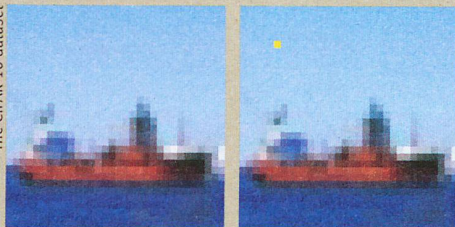
Un pixel bleu devient jaune, et le bateau se transforme en chien.