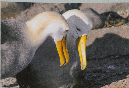
Un couple d'Albatros des Galapagos, un exemple de fidélité dans le monde animal.