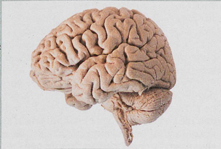
Les cerveaux ne sont pas tous pareils, mais certains se ressemblent davantage.