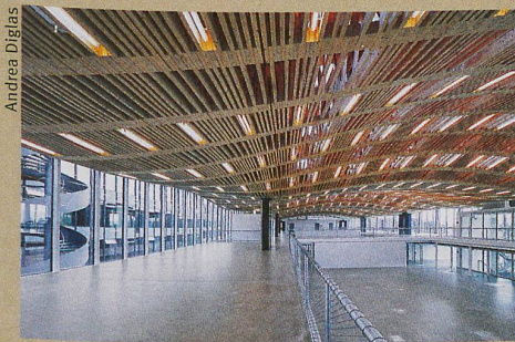
Exemple de construction numérique et robotisée: le toit du Arch-Tec-Lab à l'ETH Zurich.