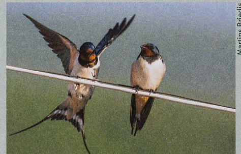
Chez les hirondelles rustiques, les mâles (à gauche) entament leur voyage avant les femelles.