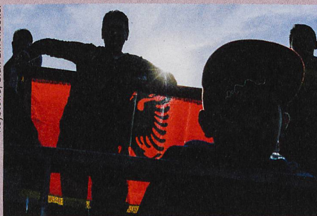
La minorité kosovaro-albanaise s'engage d'autant moins avec son ethnie qu'elle s'identifie à la Suisse.