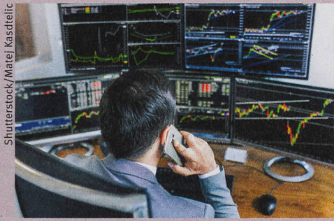
Les envolées des prix à la Bourse ne sont pas uniquement l'œuvre des traders.