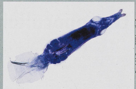
Ce petit ver de 0,5 mm infeste les branchies de poissons – le phytoplancton en profite.