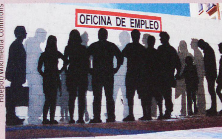
Un graffiti dans la ville espagnole de Saragosse illustre le chômage dans le pays.

M. Vacchiano et al.: The family as (one- or two-step) social capital: mechanisms of support during labor market transitions. Community, Work and Family (2019)