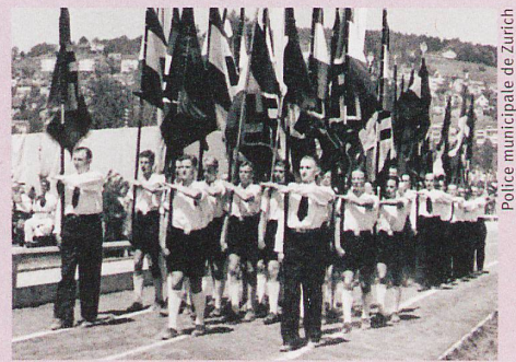
La «Colonie allemande en Suisse» marche à travers le Letzigrund en 1941.