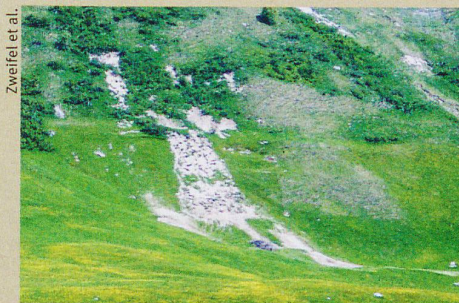
Une pente érodée dans la vallée d'Urseren, notamment à cause de l'élevage bovin.