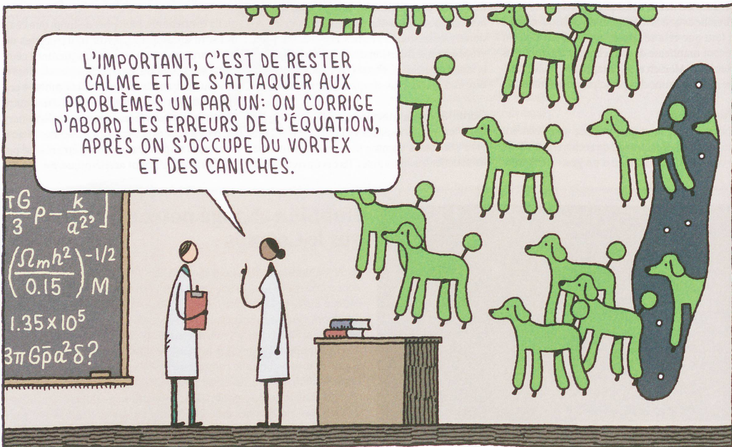
Illustration: Tom Gauld / Édition Moderne