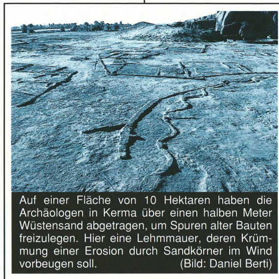
Auf einer Fläche von 10 Hektaren haben die Archäologen in Kerma über einen halben Meter Wüstensand abgetragen, um Spuren alter Bauten freizulegen. Hier eine Lehm-mauer, deren Krümmung einer Erosion durch Sandkörner im Wind vorbeugen soll.

jedoch völlig im Dunkeln bezüglich der Herkunft und des genauen Standorts dieser Zivilisation... Aus den archäologischen und historischen Daten lässt sich ableiten, dass die Blütezeit der nubischen Kultur mit dem Niedergang des Pharaonenreiches zusammenfiel. Umgekehrt verlor Kerma an Bedeutung, als dieses an Macht gewann. Während die Archäologen die Vergangenheit des alten Kerma heraufbeschwören, stossen ihre Helfer, 80 Erdarbeiter aus dem Sudan, ganz unvermutet mit ihrer eigenen Kulturgeschichte zusammen. Sie haben