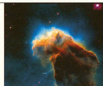
NACHRICHT AUS DEM ALL: Früher hatten die Sterne göttliche Bedeutung, heute entlockt ihnen die Forschung Informationen über die Entstehung des Universums.