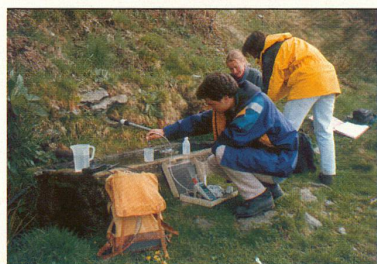
UNTERSCHÄTZT: An manchen Orten hat es zu viel Arsen im Trinkwasser, auch in der Schweiz – ein Gesundheitsrisiko?