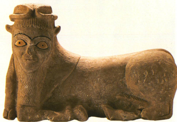
Stier mit Menschenkopf (Syrien, um 2200 v. Chr.), stellt die männliche Fruchtbarkeit dar und war vielleicht eine Nebengottheit.