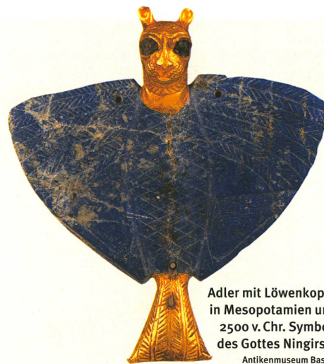
Adler mit Löwenkopf: in Mesopotamien um 2500 v. Chr. Symbol des Gottes Ningirsu Antikemuseum Basel

Weitere Informationen zu Flückigers Forschungsarbeit: www.ane.unibe.ch