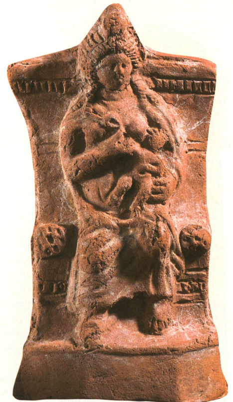
Eine spätere Version (um die Zeitenwende) der stillenden Isis