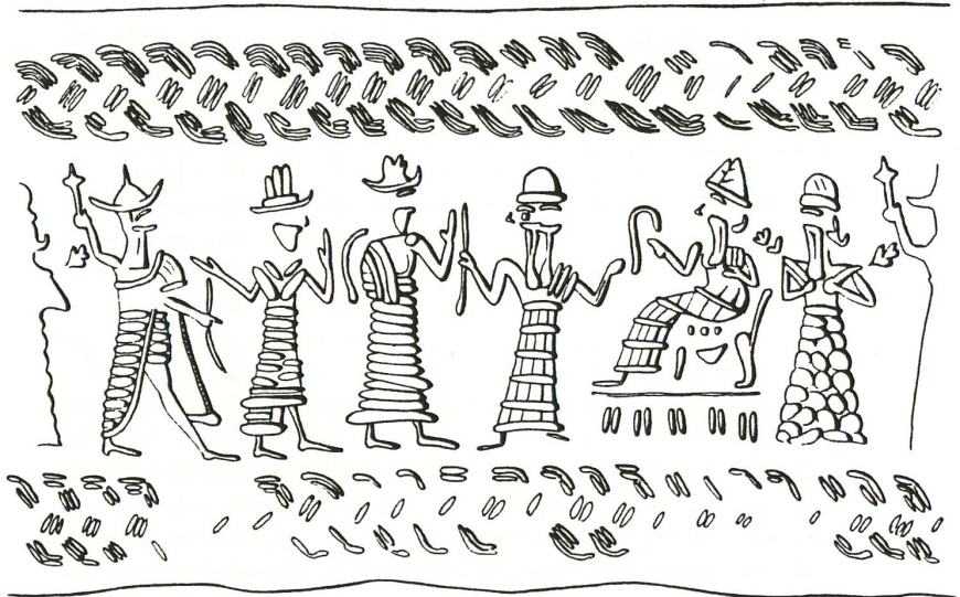
Die Götterwelt als Hofgesellschaft – Spiegel gesellschaftlicher Strukturen (syrisches Siegel, 17. Jh. v. Chr)