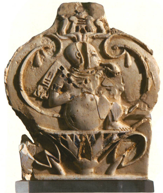
Das Sonnenkind auf der Lotusblüte als Zeuge eines intensiven Kulturaustauschs in Israel im 8. Jh. v. Chr.

Das Lexikon, an dem Uehlinger und Egger mit Unterstützung des Schweizerischen Nationalfonds arbeiten, soll daher neben der Ikonografie von Göttinnen und Göttern auch die von Dämonen dokumentieren – freundlichen wie gefährlichen. Auslöser für das Projekt war ein renommiertes Lexikon aller in der Bibel genannten Götter und Dämonen, der «Dictionary of Deities and Demons in the Bible» (B. Becking, P. van der Horst & K. van der Toorn, Leiden 1996). Das mehrere hundert Seiten starke Werk, an dem über 100 Autoren aus aller Welt beteiligt waren, hat nur einen Makel: Es weist kein einziges Bild auf. Der Verlag fragte Uehlinger an, ob er einen bebilderten Ergänzungsband herausgeben wolle. Diese Aufgabe erwies sich als schwierig: Einerseits gibt es nicht zu allen Göttern und Dämonen, die in der Bibel genannt werden, auch entsprechende Bilder, andererseits werden zahlreiche Götter und Dämonen in der Bibel nie erwähnt, obwohl sie in nicht-biblischen Texten und in Bildern jener Zeit und Gegend häufig vorkommen und daher von grosser Bedeutung gewesen sein mussten. Deshalb wurde nicht die Bibel, sondern die «Welt der Bibel», von Ägypten bis Iran, von Arabien bis Griechenland, als Bezugsrahmen genommen. Ob ein Stichwort im Lexikon auftaucht oder nicht, entscheidet nicht mehr der Bibeltext, sondern der Bildquellenbefund.