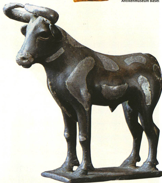
Der Stier, ein sumerisches göttliches Symbol um 2500 v. Chr.