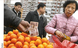
Links: Stadtansicht von Schanghai mit dem Fluss Huangpu und der bekannten Promenade Bund. Oben: Strassenmarkt in Peking. Die chinesischen Zeichen im Text bedeuten «China» (klein, S. 18) und «Menschenrechte» (gross).

Gegenläufige buddhistische Werte Ein weiteres interessantes Resultat ergibt sich aus den religiösen Werthaltungen. In den Internetesites grosser religiöser Gruppierungen, vor allem der chinesisch-buddhistischen, chinesisch-taoistischen und konfuzianistischen Vereinigungen, ermittelte die Wissenschaftlerin wichtige religiöse Werte und liess sie in den Fragebogen einfließen. Es zeigte sich, dass bestimmte Wertekombinationen direkt mit der Haltung zu Menschenrechten gekoppelt sind. Wer gesellschaftsbezogene, vor allem im Konfuzianismus wichtige Werte wie Wohltätigkeit, Respekt gegenüber anderen und klassisch hierarchische Familienstrukturen hochhält, findet auch Menschenrechte wichtig. Wer klassisch