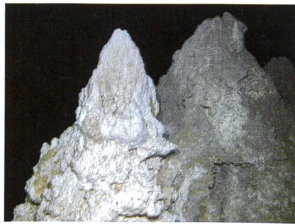
Die Kalktürme beherbergen extreme Lebewesen.

Mitten im Atlantischen Ozean erhebt sich eine «verlorene Stadt»: Grandios geformte, weisse Schloten ragen über 60 Meter in die Höhe. Diese Strukturen interessieren die Forschenden mehr als das sagenhafte Atlantis. Mit gutem Grund, denn auf ihnen wimmelt es nur so von Leben, und es wird vermutet, dass die dort herrschenden Bedingungen sehr ähnlich sind wie jene zur Zeit der Entstehung des Lebens. «Lost City» befindet sich 15 Kilometer von der Achse des Mittelatlantischen Rückens entfernt in 900 Meter Tiefe und auf 30° nördlicher Breite. Eine Reihe von Verwerfungen lassen an diesem Ort Gestein aus dem Erdmantel hervortreten. Durch Wechselwirkungen zwischen diesem Gestein und dem Meerwasser entstehen stark methan- und wasserstoffhaltige Flüssigkeiten mit einem pH-Wert zwischen 9 und 11 und einer Temperatur von 40 bis 90°C. Treffen die Flüssigkeiten auf Meerwasser, wird Kalk (Kalziumkarbonat) ausgefällt. So entstehen Kalkgebilde, die eine Höhe von mehreren Dutzend Metern erreichen können. Sie beherbergen ein Ökosystem, das hauptsächlich aus Archaea besteht.