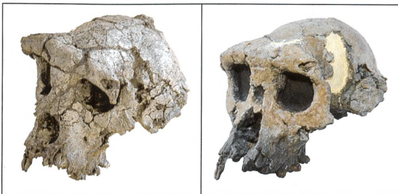
Der Schädel von Toumaï vor und nach der Rekonstruktion.