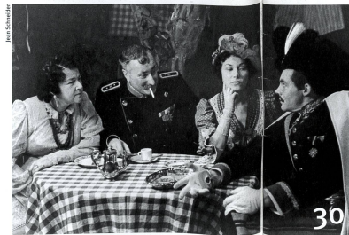
Erstes grosses Lexikon zum Theaterschaffen in der Schweiz