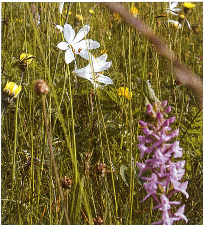
Karin Maurer/Uni Basel