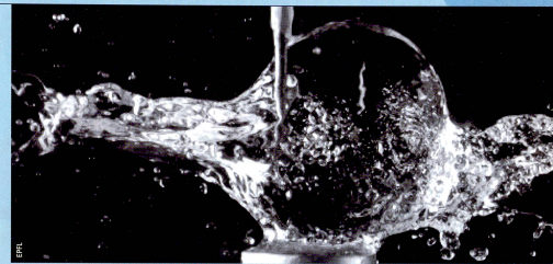
Bei der Kavitation bilden sich durch Druckveränderungen Blasen, die implodieren. Dies verstärkt z.B. die Erosion von Wasserturbinen und Schiffspropellern (links). Die Schwarzweissbilder zeigen die Kavitation in der Schwerelosigkeit: Flüssigkeit in Kugelform; darin implodiert eine Blase (ganz oben), und es entstehen zwei Strahlen (oben).

werden damit verschiedene Schaufelprofile. «Wir haben auch eine Technik entwickelt, mit der über die Messung von Vibrationen die Auswirkungen der Schockwellen in hydraulischen Maschinen festgestellt werden können.» Die Kavitation spielt sich in so mikroskopisch kleinen Räumen ab, dass die direkte Messung kaum möglich ist. Die Wissenschaftler stützen sich deshalb auf die leuchtende Handschrift dieses Phänomens. «Wenn die Blasen implodieren, wird das darin eingeschlossene Gas so stark komprimiert, dass dabei Temperaturen von mehreren hundert-