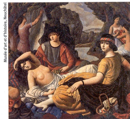
«Après le bain», 1921–22