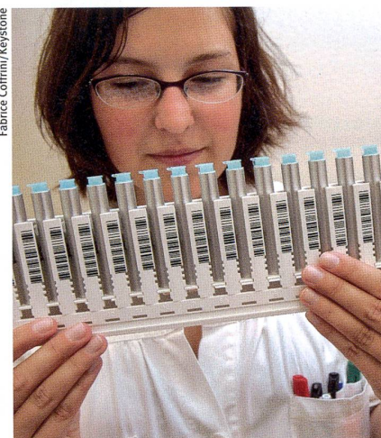
Körperfremde Substanzen – oder doch keine?

Law, Probability and Risk, 2008, Bd. 7, Nr. 3, S. 191–210