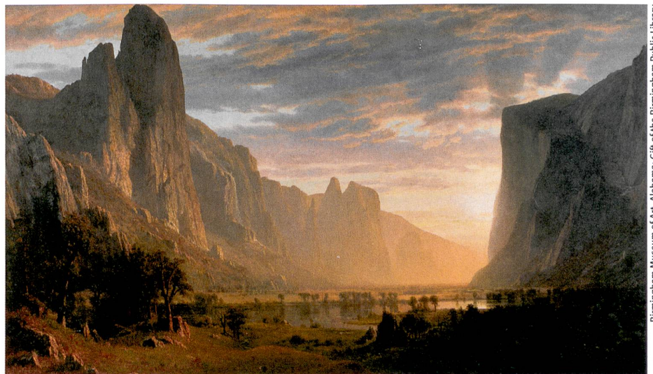
Birmingham Museum of Art, Alabama; Gift of the Birmingham Public Library

Wolf Linder, Christian Bolliger, Yvan Rielle (Hg.): Handbuch der eidgenössischen Volksabstimmungen 1848 bis 2007. Haupt-Verlag, Bern 2010, 755 S. Die Online-Datenbank swissvotes.ch bildet eine Ergänzung zum Handbuch.