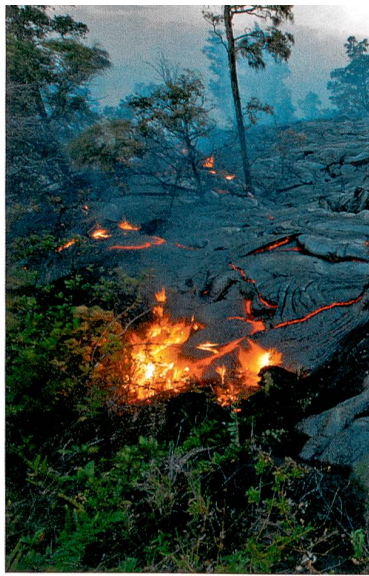
Nicht ungefährlich: Hawaiis Vulkane können beträchtlichen Schaden anrichten. Alain Volentik (links: auf den Überresten eines zerstörten Hauses) sucht die Gefahren einzuschätzen, die von Bruchzonen im Vulkangebiet ausgehen.