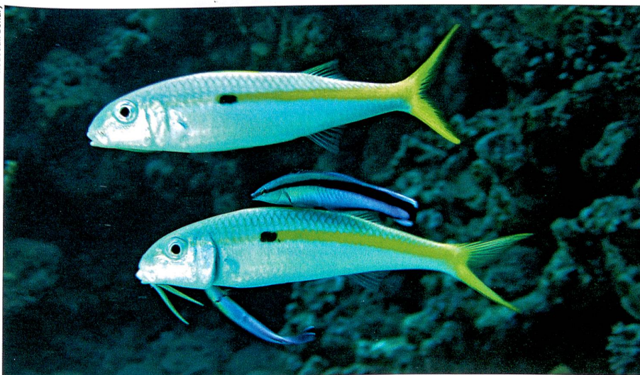
Reinigen oder beissen? Die kleinen Putzerfische sind permanent im Dilemma.