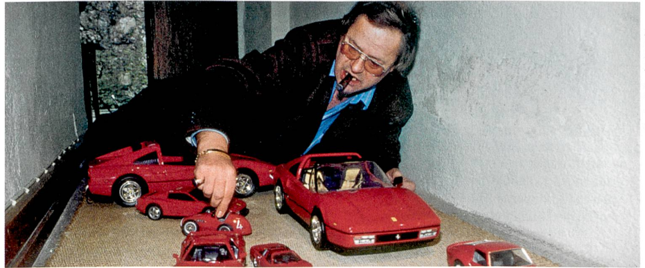
Inmitten der Boliden: der Literat und seine favorisierten Automobile