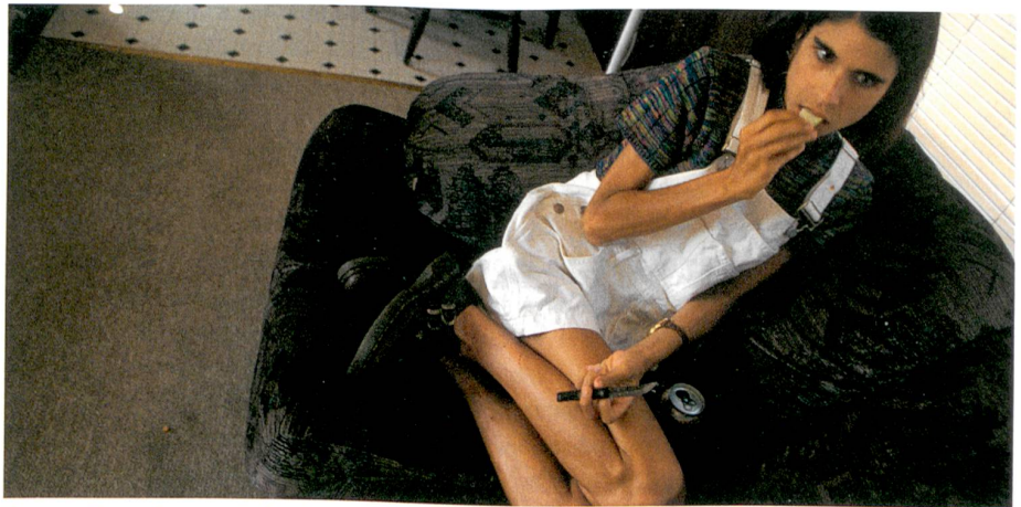
Unterernährung kann zu Unfruchtbarkeit führen: An Magersucht erkrankte junge Frau (Oklahoma, 1997).