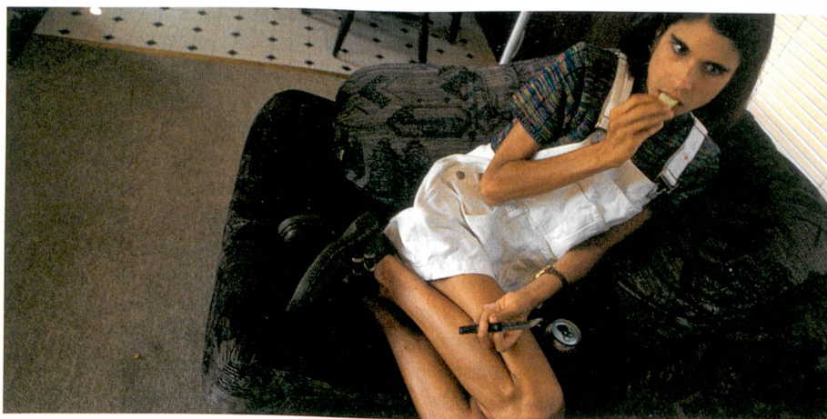
Unterernährung kann zu Unfruchtbarkeit führen: An Magersucht erkrankte junge Frau (Oklahoma, 1997).