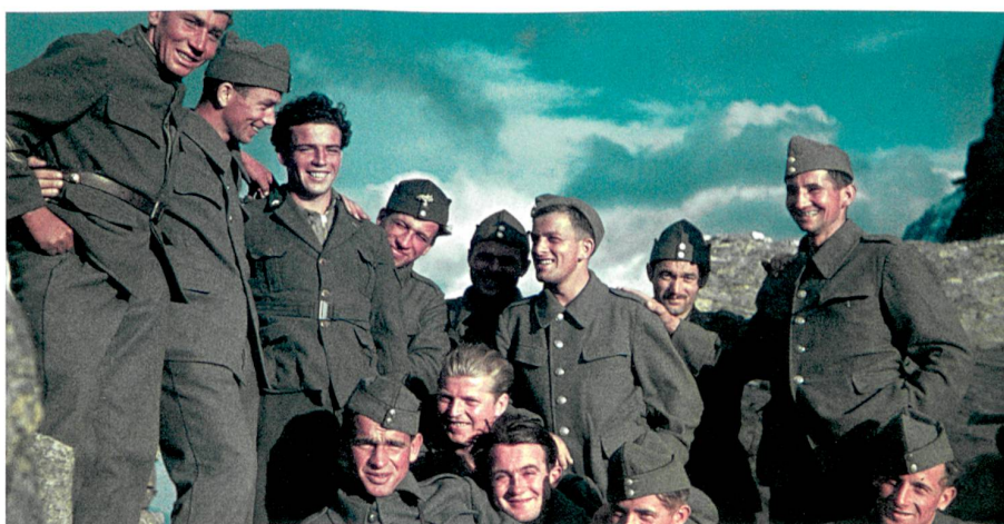
Unter Männern: Schweizer Soldaten kurz nach Kriegsausbruch an der italienischen Grenze, 1940.