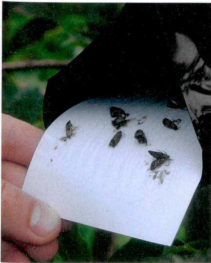
In der Falle: Apfelwickler im Flugstadium sind dem Pheromon auf den Leim gekrochen.