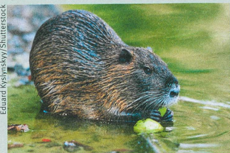
Auch die Bisamratte ist unerwünscht.

Tim M. Blackburn et al. (2014): A Unified Classification of Alien Species Based on the Magnitude of their Environmental Impacts. PLoS Biology 12: e1001850.