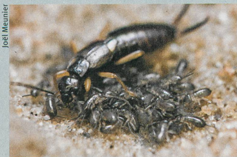
Ein Ohrwurmweibchen pflegt seine Jungen.

J.W.Y. Wong, C. Lucas & M. Kölliker (2014): Cues of Maternal Condition Influence Offspring Selfishness. PLoS ONE 9: e87214.