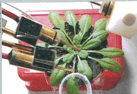
Unter Strom: Die Elektroden messen die elektrischen Aktivitäten der Acker-Schmalwand.