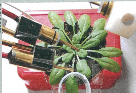
Unter Strom: Die Elektroden messen die elektrischen Aktivitäten der Acker-Schmalwand.